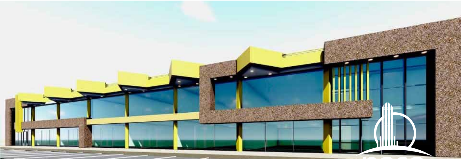
ناسا مول العمارات شارع ٤١